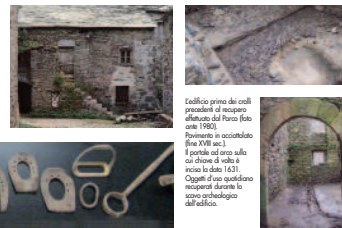
Costrutto prima dei secoli precedenti al recupero effettuato dal Parco (foto ante 1900). Pavimento in ciottolato (fine XVIII sec.). I portali ad arco sulla cui chiave di volta è inciso lo stemma del Comune. Oggi di uso quotidiano recuperati durante lo scavo archeologico dell'edificio.

possibile la riproposizione di tecniche costruttive e lavorazioni tradizionali ormai desuete. Con questa esperienza si è così attuato un modello cui riferirsi per operare futuri analoghi interventi di recupero nel borgo. Gli spazi del rifugio consentono di accogliere per il pernottamento fino a 12 ospiti, che trovano alloggio ai piani superiori in due camerette (con bagno dedicato) e, al piano terra, possibilità di conferzionamento di cibi in una cucina allestita in maniera confortevole e funzionale, con adiacente sala da pranzo/soggiorno. I locali al piano terra sono accessibili anche da persone con disabilità motorie; su richiesta è possibile allestire un posto letto idoneo. All'interno del Rifugio sono conservati, in visione ai fruitori, una serie di oggetti ricavati da scavi archeologici effettuati parallelamente ai lavori edilizi, che testimoniano l'uso quotidiano dell'edificio e forniscono interessanti evidenze della storia del borgo e dell'edificio, dimostratisi antecedente al XVII sec. Il Rifugio potrà costituire un polo di eccellenza per promuovere nel comprensorio l'attività turistica ed escursionistica e, auspicabilmente, contribuire all'avvio del recupero e della rivitalizzazione dell'antico borgo di Ventarola.